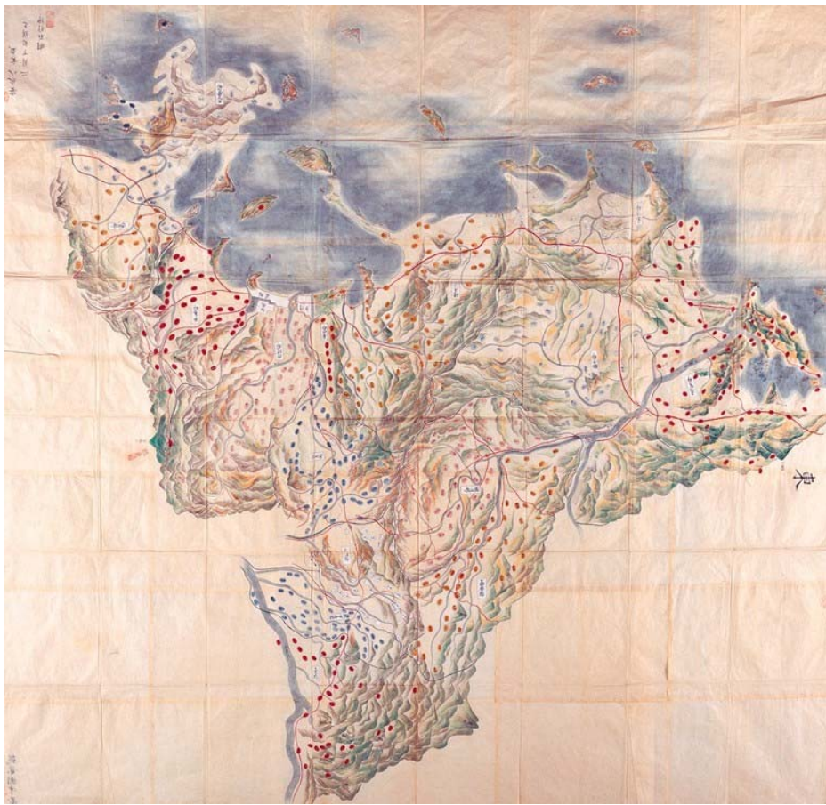
当館所蔵「筑前国中図」（「大田資料」310号）