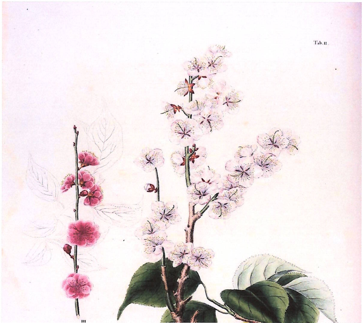
福岡県立図書館シーボルトコレクション「日本植物誌」より（「ウメ」）