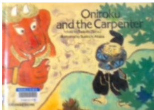
『Oniroku and the carpenter』