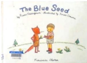
『The blue seed』